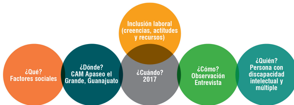
Figura 5. Visualización gráfica del método cualitativo