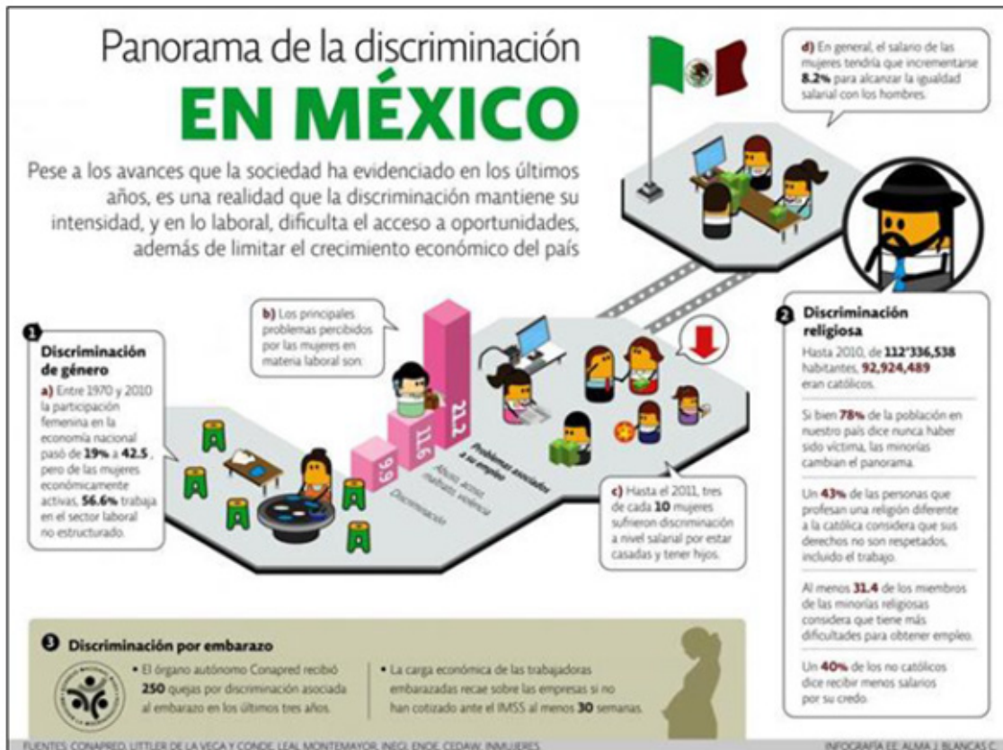
Figura 3. Panorama de la discriminación en México.