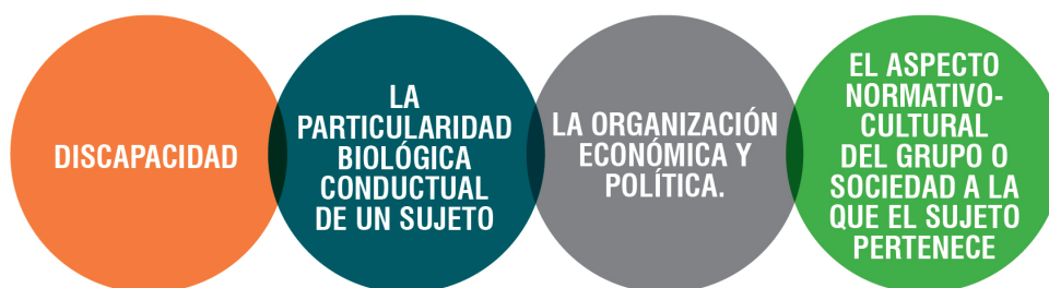
Figura 2. Modelo de análisis para entender la construcción social de la discapacidad.