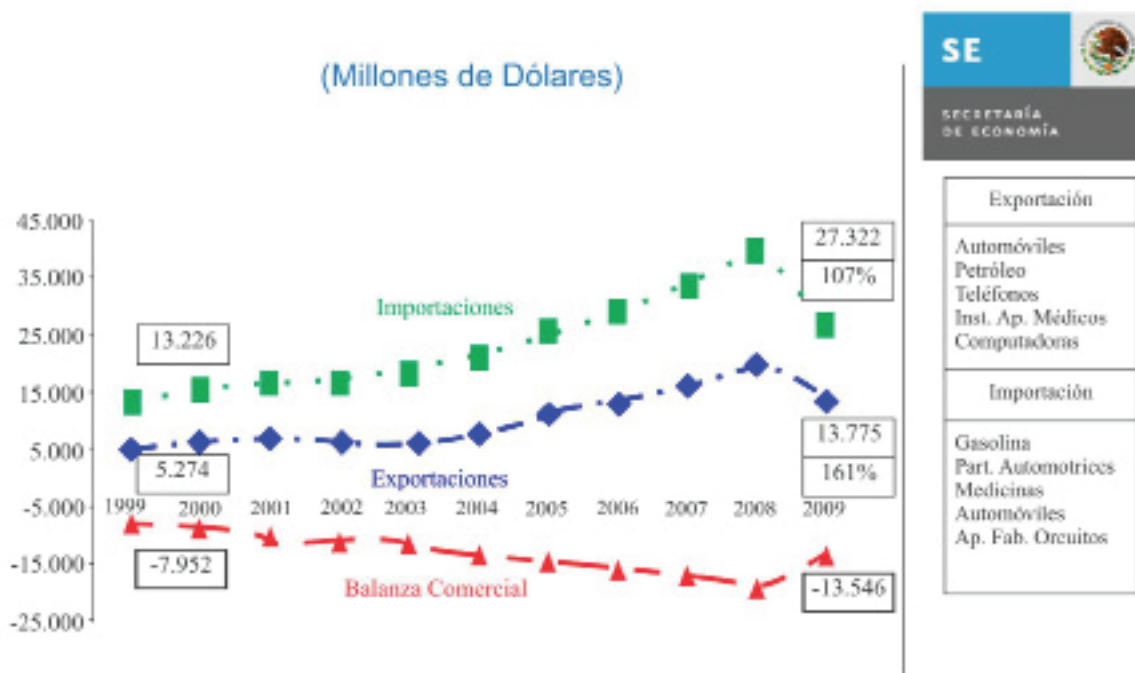
GRAFICA 1 Evaluación del TLCUEM a 10 años Secretaría de Economía (2010)

A continuación de muestra un análisis de 10 años realizado por la SE teniendo en cuenta el Tratado y sus aspectos principales.